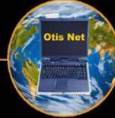
Otis Net global network