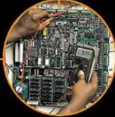
OTISLINE comms center